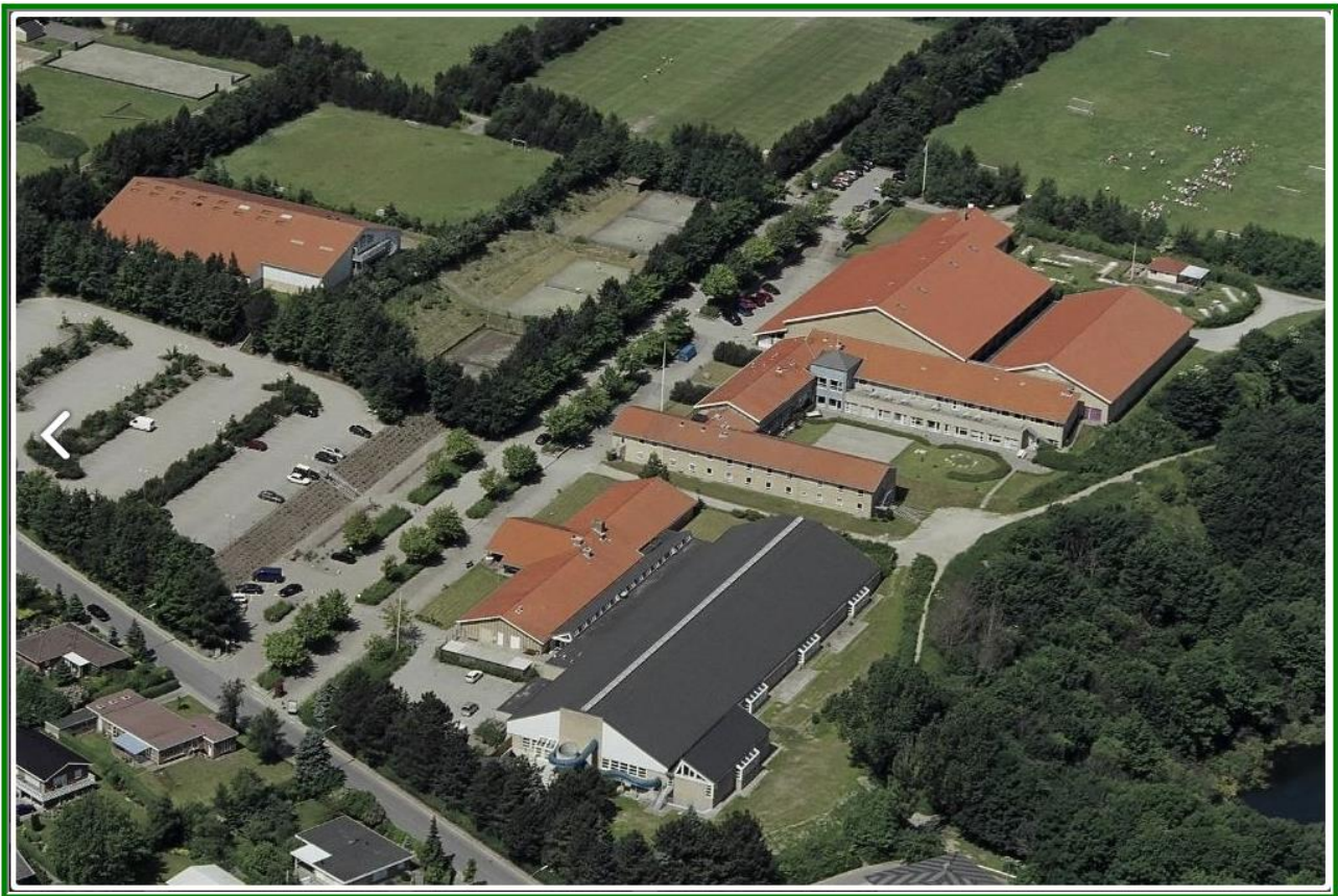
Til venstre Squash- og Tenniscentret og øverst til højre Hal 1 og 2.

I Nørresundby spilles i Nørresundby Idrætscenters Hal 1 og i Squash- og Tenniscentret.