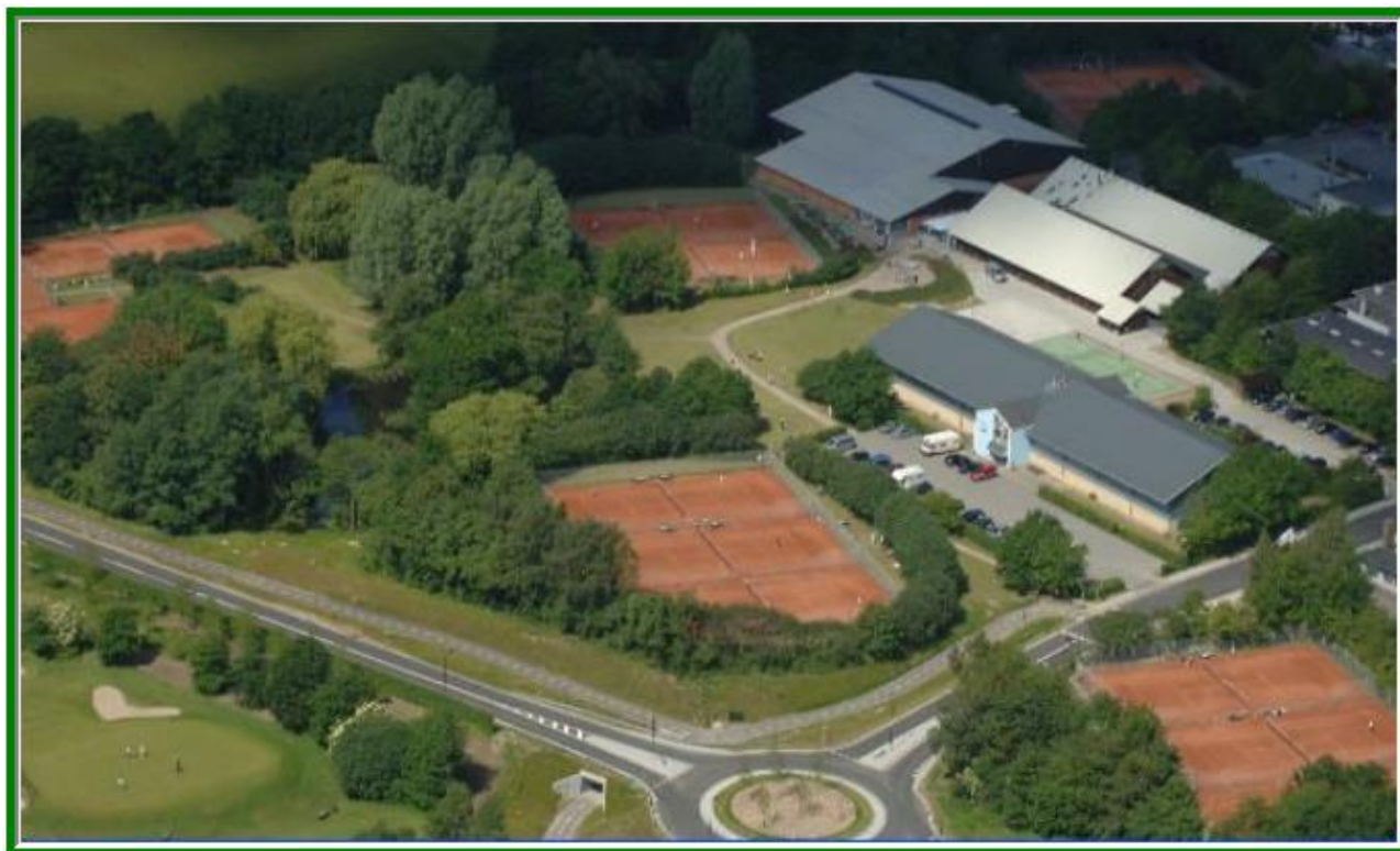
Badmintonhallen forrest med squash- og tennishallerne bagerst

I Birkerød spilles på det glimrende ketsjersportsanlæg på Topstykket.